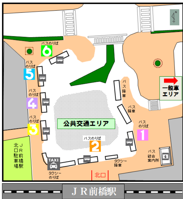
前橋駅北口 バス・タクシーのりば