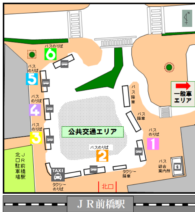
前橋駅北口 バス・タクシーのりば